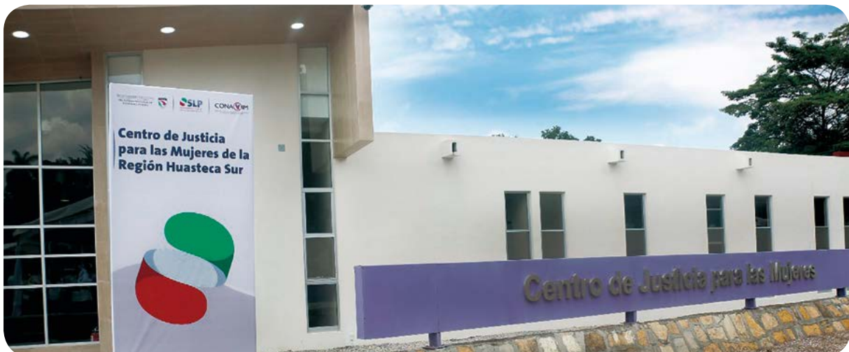
Centro de Justicia para las Mujeres en Matlapa.