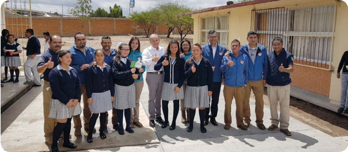
Campaña Un like por la prevención en Telesecundaria Manuel José Othón.

Se continúa llevando a cabo el programa denominado Prevenimos Juntos , el cual tiene el propósito de llegar a todos los sectores de la sociedad a través de las acciones Prevenir Educando , dirigida a alumnos de los niveles de preescolar y primaria; ¡Alerta! 12-29 , dirigida a alumnos de secundaria, preparatoria y universidades; Mujeres en Movimiento , dirigida a mujeres amas de casa, profesionistas y trabajadoras; y Fuerza Productiva , dirigida a la población económicamente activa. En el periodo que se informa se impartieron pláticas de prevención para beneficio de 128 mil 955 personas.