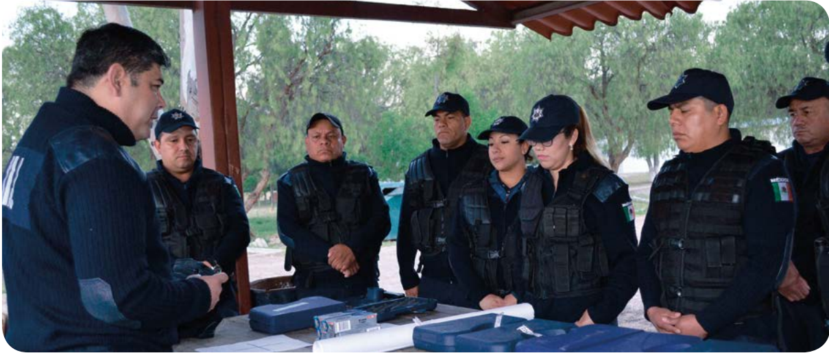
Capacitación en manejo de equipo táctico.

En el marco de la cooperación interinstitucional internacional la Embajada de los Estados Unidos en México a través del programa Iniciativa Mérida ; donó equipamiento tecnológico, consistente en cuatro equipos para los operadores del Sistema de Justicia Penal de la Dirección General de Ejecución de Medidas para Menores. Asimismo, en colaboración con la Organización Internacional Oficiales de la Paz , dedicada a brindar de manera gratuita cursos a elementos policiales de diferentes países; se capacitó a todo el personal de seguridad y custodia del Centro de Internamiento Juvenil, en técnicas de sometimiento, ética policial y cómo sobrellevar el estrés.