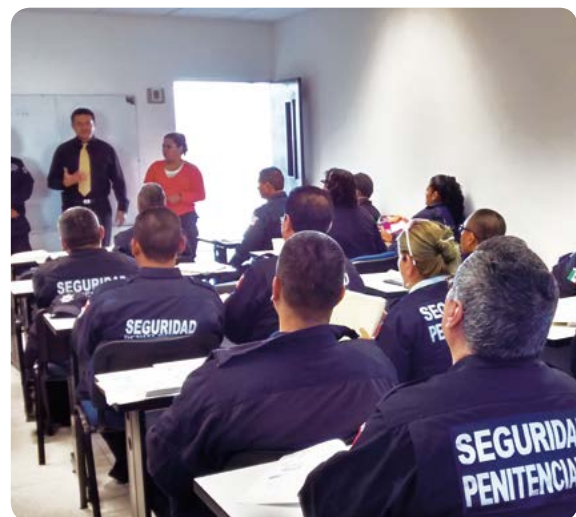
Curso de actualización al personal de seguridad y custodia.

Durante esta Administración se ha capacitado a un total de quince funcionarios de la Dirección General de Prevención y Reinserción Social en temas de liderazgo ejecutivo internacional y traslado de alto riesgo en las academias de las correccionales estadounidenses de Santa Fe, Nuevo México; Maryland; California; y Canyon City, Colorado.