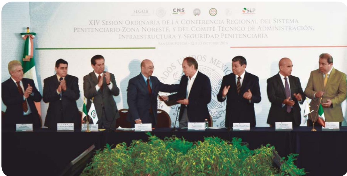
Entrega de reconocimiento por el cierre de las cárceles distritales del Estado.

En el marco de la celebración del Día del Personal Penitenciario , Día Internacional de Nelson Mandela , fue reconocido el trabajo del personal del sistema penitenciario nacional de los 32 estados del País, entre ellos tres trabajadores de la Dirección General de Prevención y Reinserción Social en San Luis Potosí. Durante el evento realizado en la Ciudad de México, el Comisionado Nacional de Seguridad reconoció el trabajo y trayectoria recta y honorable del Director del