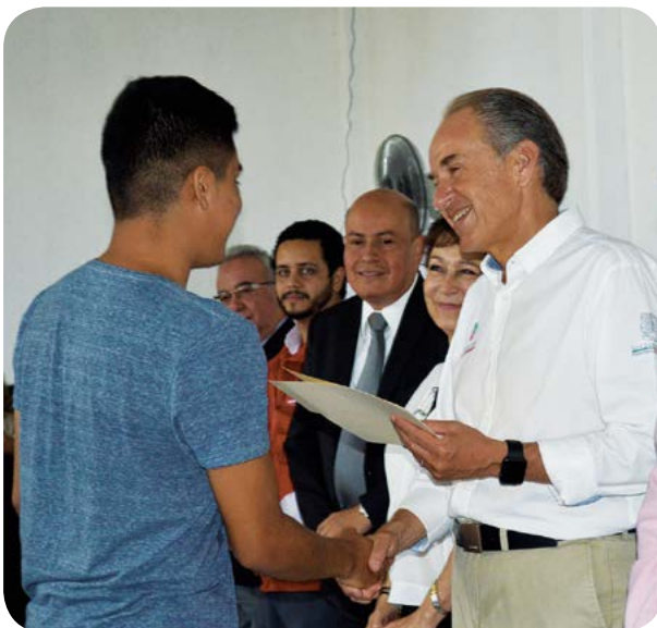
Entrega de certificados de estudios a potosinos con rezago educativo Plaza Tlasaloua.

En materia de prevención a través del Centro de Desarrollo Comunitario y Plaza Comunitaria Tlasaloua, se realizaron asesorías académicas, aplicación de exámenes de nivel educativo básico, sesiones de orientación, consejería familiar, cursos y talleres de capacitación en beneficio de 912 usuarios.