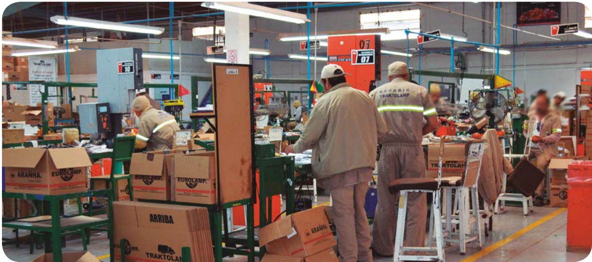
Población interna del Centro de Reinserción Social La Pila en actividades laborales.