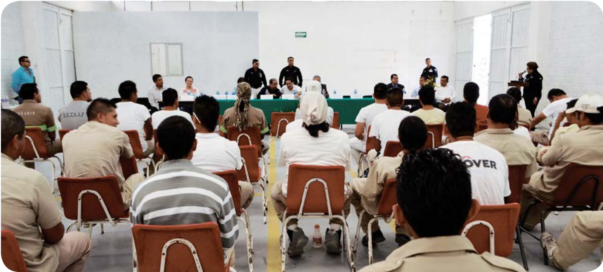
Taller de la Tercera Jornada de Prevención del Delito.