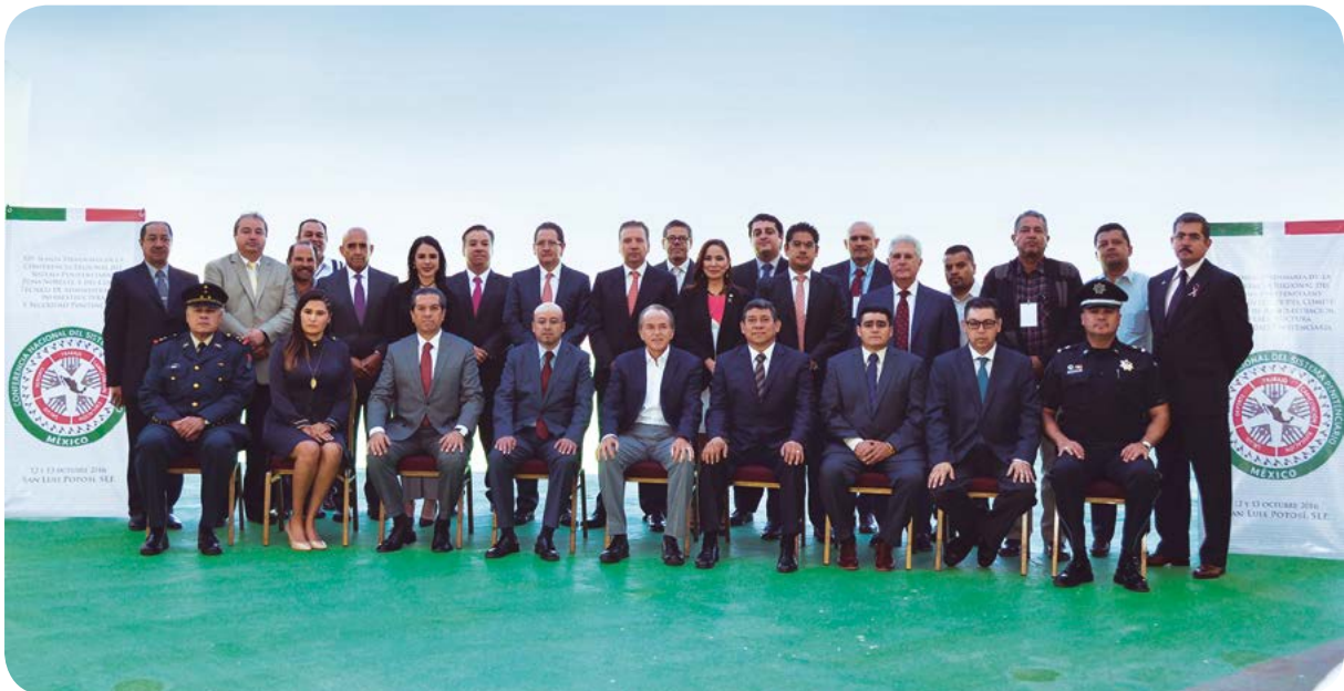
XIV Sesión ordinaria de la Conferencia Regional del Sistema Penitenciario.

Con estas acciones se apoya al interno en una forma integral, se capacita y profesionaliza al personal de seguridad y custodia, se dignifican y fortalecen los espacios de los centros penitenciarios con obras de mejoramiento y rehabilitación, además no existe hacinamiento ya que la población actual corresponde al 70 por ciento de la capacidad instalada, además se mantiene el orden y el buen gobierno al interior de los centros penitenciarios con fundamento en operativos y protocolos de seguridad.