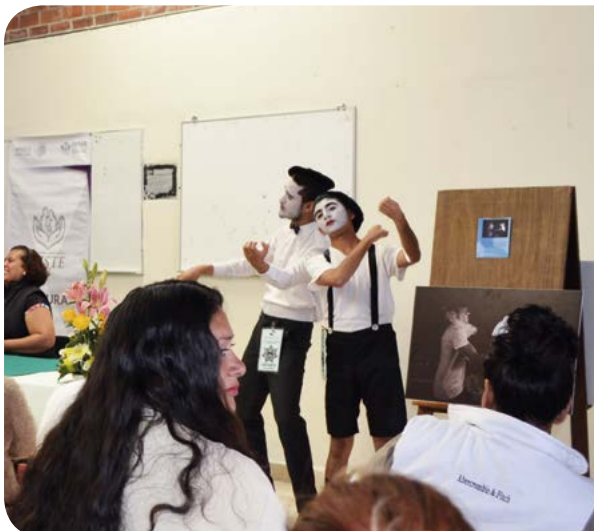
Festival de Cultura 2017, en sección femenil del Centro de Reinserción Social La Pila.