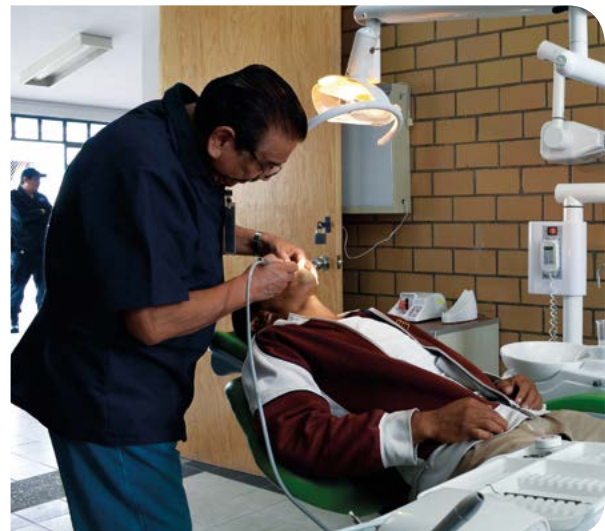
Revisión dental a interno del Centro de Reinserción Social La Pila.