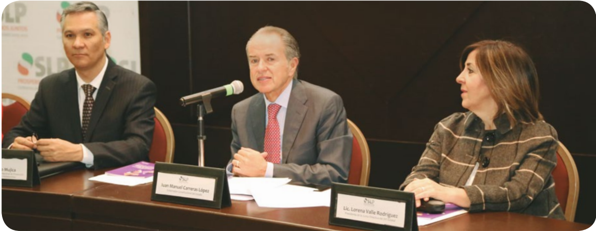
Segunda Sesión Ordinaria del Sistema Estatal de Protección Integral de Niñas, Niños y Adolescentes de San Luis Potosí (SIPINNA).

Los mecanismos de coordinación interinstitucional que el Ejecutivo estatal ha promovido para la atención y protección de los Derechos Humanos son las siguientes Comisiones de: