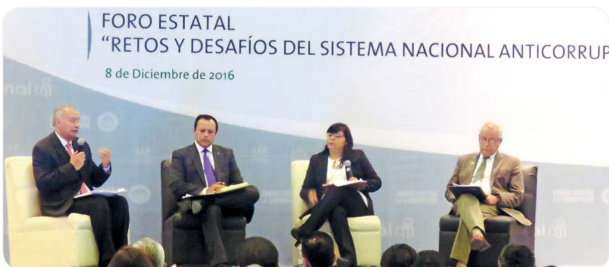
Foro Estatal Sistema Nacional Anticorrupción.

San Luis Potosí pasó de ser en 2013 primer lugar nacional en experiencias de corrupción, a ser el lugar 25 en 2015