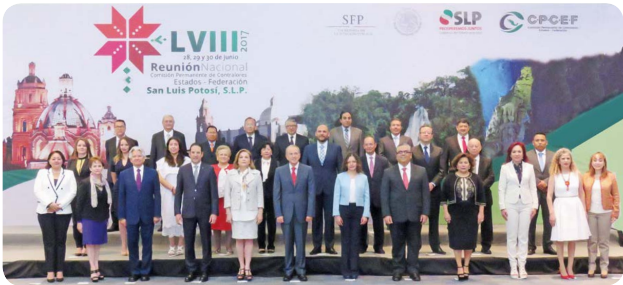
LVIII Reunión Nacional de la CPCE-F en San Luis Potosí.

En ese marco de colaboración, también se reactivó la Comisión Permanente de Contralores Estado-Municipios , a través de la cual se trabaja en el establecimiento del Modelo Integrado de Control Interno a nivel municipal, así como en una mejor fiscalización de los recursos federales y estatales.