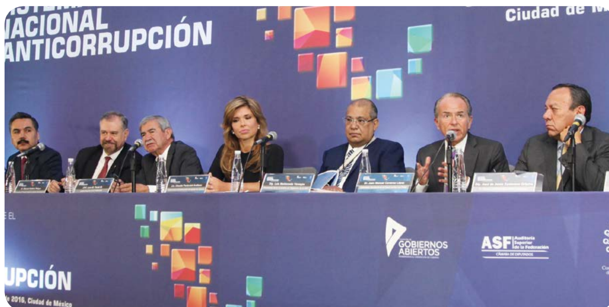
Encuentro sobre el Sistema Nacional Anticorrupción.

El Ejecutivo estatal impulsa la capacitación y sensibilización de sus funcionarios en torno a la nueva cultura de responsabilidad que debe prevalecer en el servicio público. Destaca la realización del Foro Estatal Retos y Desafíos del Sistema Nacional Anticorrupción , así como el evento Gobierno Responsable , donde el Gobierno del Estado ratificó el compromiso de actuar con apego a la ley y combatir la corrupción.