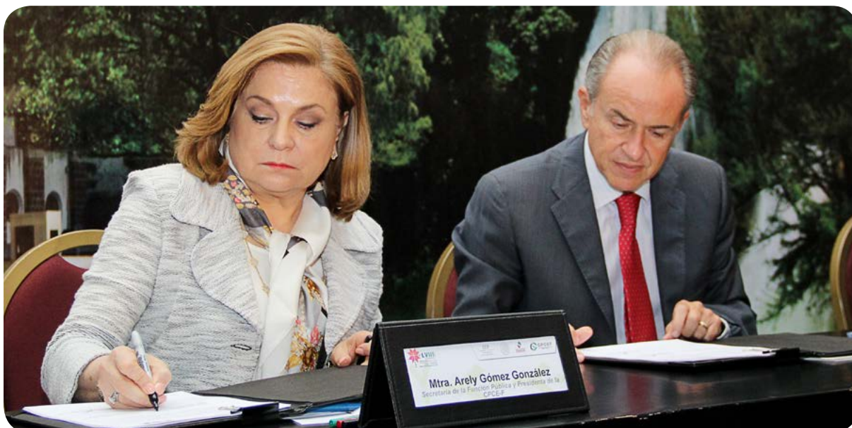
Firma de Convenio Declaranet PLUS.