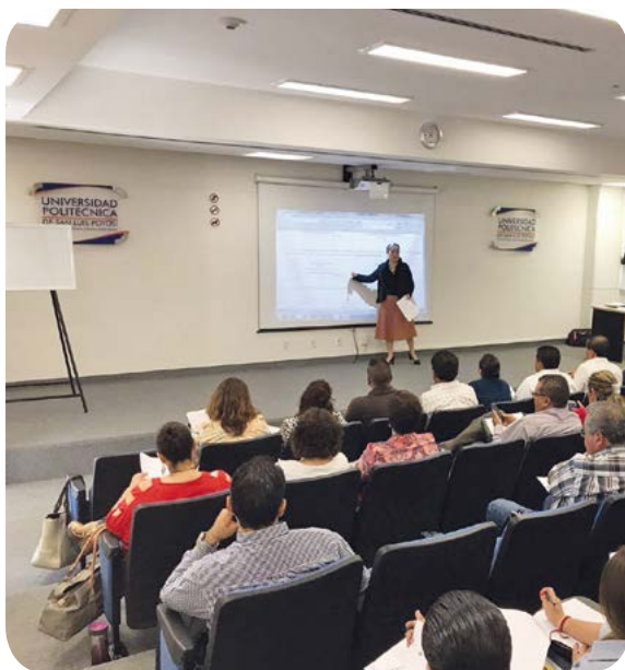
Evento de capacitación en materia de armonización contable.

En cumplimiento de la normativa establecida por el Consejo Nacional de Armonización Contable (CONAC) , así como de los criterios para la elaboración y presentación homogénea de la información financiera y de los formatos a que hace referencia la Ley de Disciplina Financiera, se ha complementado la información presentada en los informes de Cuenta pública estatal y se han atendido diversos requerimientos solicitados por el Portal de Comunicación para la Armonización Contable (PC@C) .