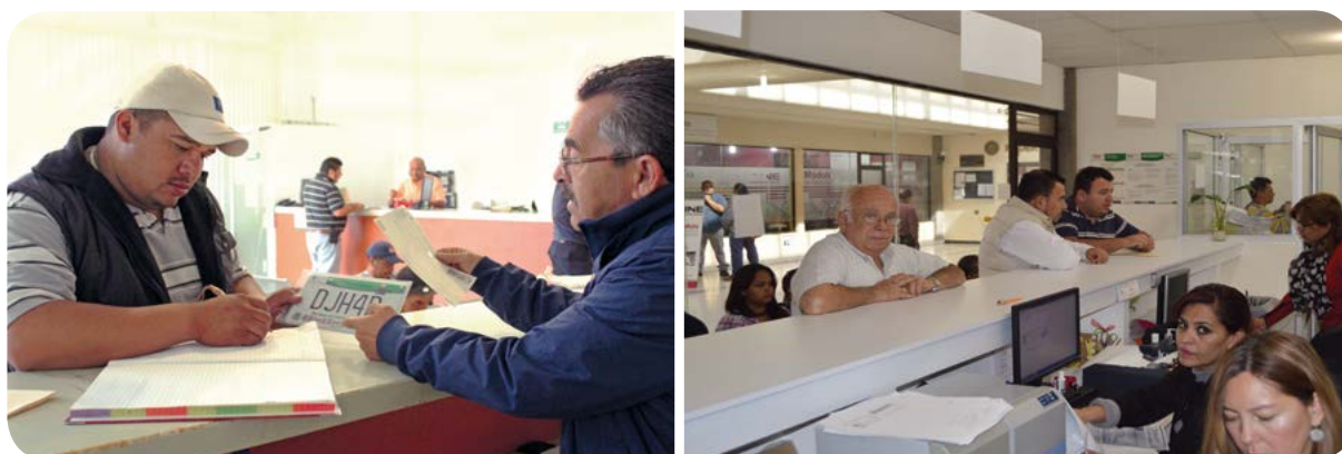
Servicios de la Secretaría de Finanzas.

Con el objeto de facilitar a los contribuyentes la regularización de su situación fiscal, en los meses de noviembre y diciembre de 2016 se llevó a cabo un programa especial denominado Última Oportunidad , el cual ofreció descuentos para beneficio de más de 30 mil potosinos con ahorros por 95.2 mdp.