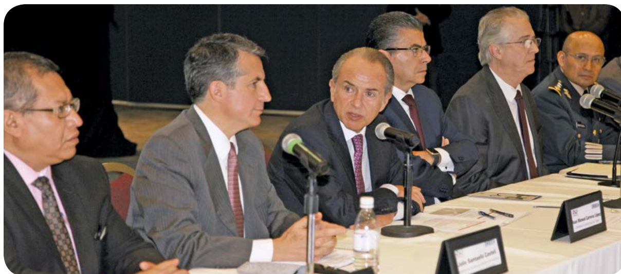
Sesión de instalación del Comité Estatal de Información Estadística.

En el marco de este Comité se avanza en la conformación del sistema de gestión de la red carretera estatal, el diagnóstico de las estadísticas vitales y la primera etapa del Sistema Estatal de Información ; además se coordinó la realización local del Censo Nacional de Gobierno .