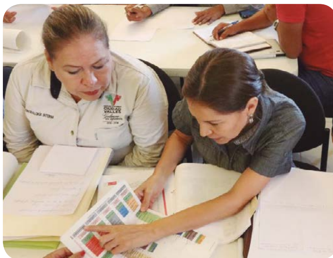
Taller para la elaboración de programas y proyectos.

En coordinación con el Consejo Nacional de Evaluación de la Política de Desarrollo Social (CONEVAL), se realizó una evaluación piloto nacional para identificar aspectos susceptibles de mejora que optimicen el ejercicio de los recursos correspondientes al Fondo de Aportaciones para el Fortalecimiento de las Entidades Federativas (FAFEF) .