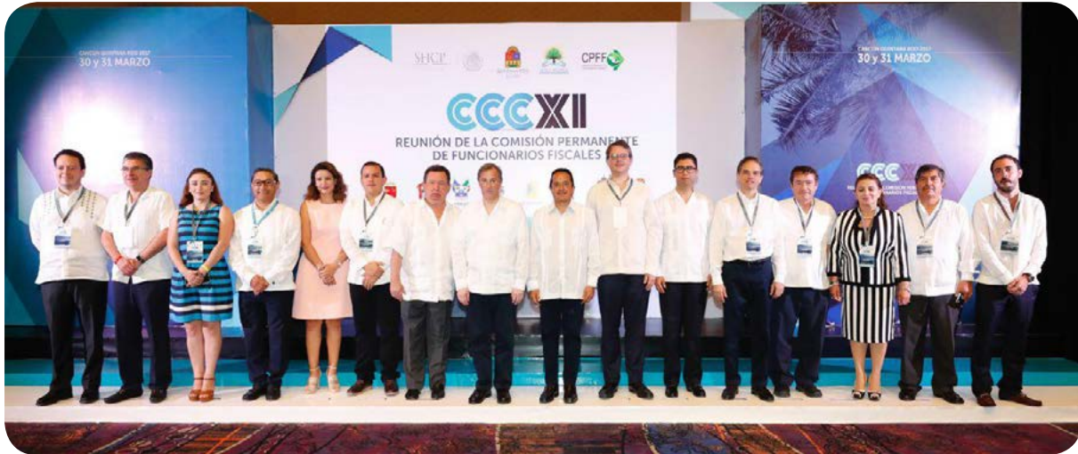
Reunión de la Comisión Permanente de Funcionarios Fiscales.

En el marco de este Sistema , se capacitaron 333 funcionarios estatales y municipales para la captura en el Sistema de Formato Único de la SHCP del ejercicio, destino y resultados obtenidos de los recursos federales transferidos.